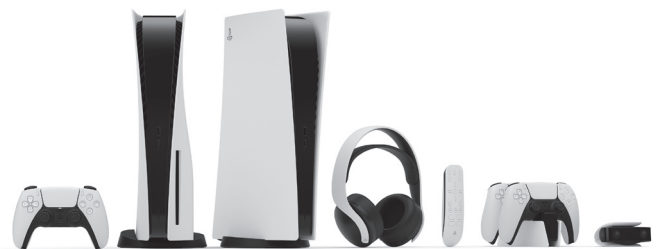
DualSense™ ワイヤレスコントローラー、本体、PULSE 3D ワイヤレスヘッドセット、メディアリモコン、DualSense™ 充電スタンド、HDカメラ (写真左より)