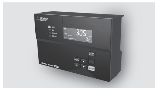
●図2 モータ診断装置「DiaPro Motor*2」