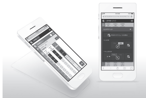
●図3 エレベータークラウドサービス 「BuilUnity*3」